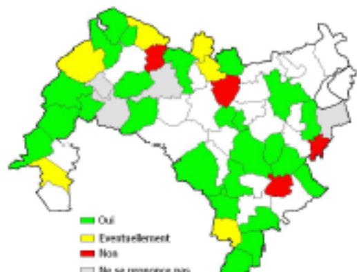
Communes prêtes à signer une charte paysagère dans l'immédiat

Pourtant les attentes de la société et des citoyens sont de plus en plus importantes en matière de cadre de vie, et l'environnement pourrait bien s'inviter ici aussi au cœur des débats des prochaines élections locales. La charte offre ainsi une opportunité aux politiques d'afficher leur engagement en matière de paysage et d'environnement, et de répondre aux attentes sociologiques locales.